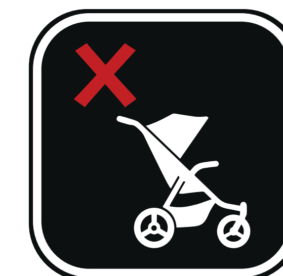
LES POUSETTES STROLLERS