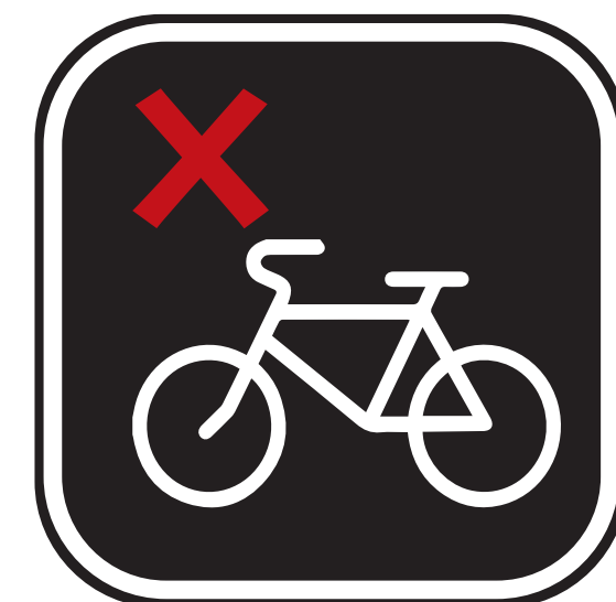
MOTOS, VÉLOS OU TOUT AUTRE TYPE DE VÉHICULE MOTORCYCLES, BICYCLES, OR ANY OTHER TYPE OF VEHICLE