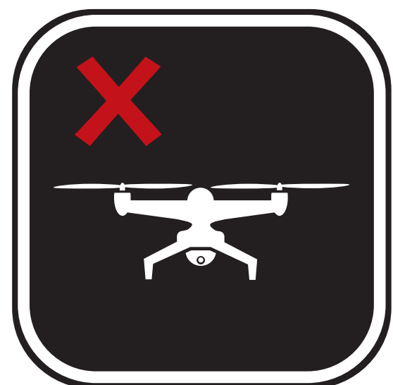
DRONES OU AÉRONEFS SANS PILOTE DRONES OR UNMANNED AERIAL DEVICES