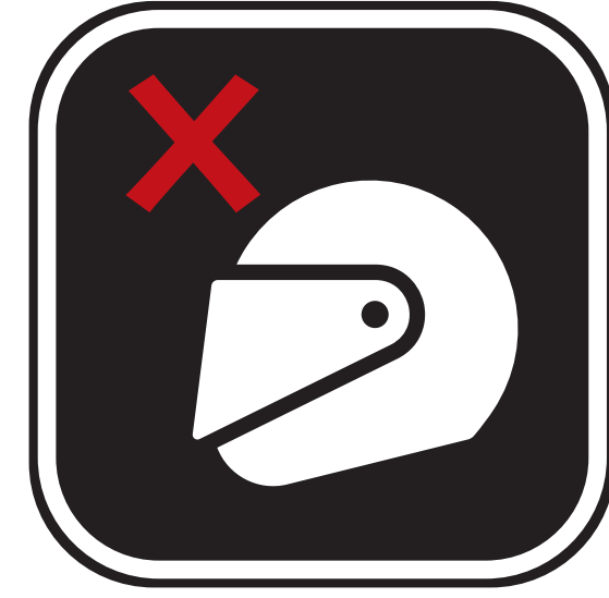
LES CASQUES DE 2 ROUES MOTORISÉES MOTORCYCLE HELMET WITH VISOR