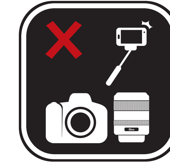
POTEAUX, MÂTS DE DRAPEAU, BÂTONS, GRAND ÉQUIPEMENT PHOTOGRAPHIQUE ET BATTES POLES, FLAGPOLES, STICKS, LARGE PHOTOGRAPHY EQUIPMENT (TRIPODS) AND BATS