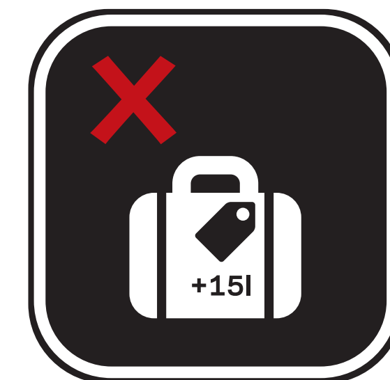
LES GROS OBJETS COMME LES VALISES OU LES ARTICLES TROP VOLUMINEUX POUR ÊTRE CONTROLES ÉLECTRONIQUEMENT LARGE OBJECTS SUCH AS SUITCASES OR ITEMS TOO LARGE TO BE ELECTRONICALLY SCREENED