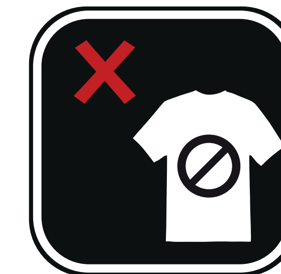
VÊTEMENTS D'IMITATION FE FE IMITATION CLOTHING