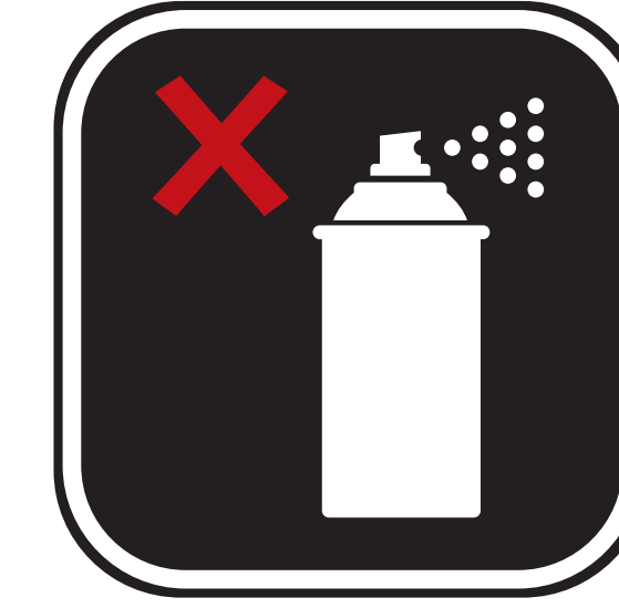
BOMBES AÉROSOLS AEROSOL CANS