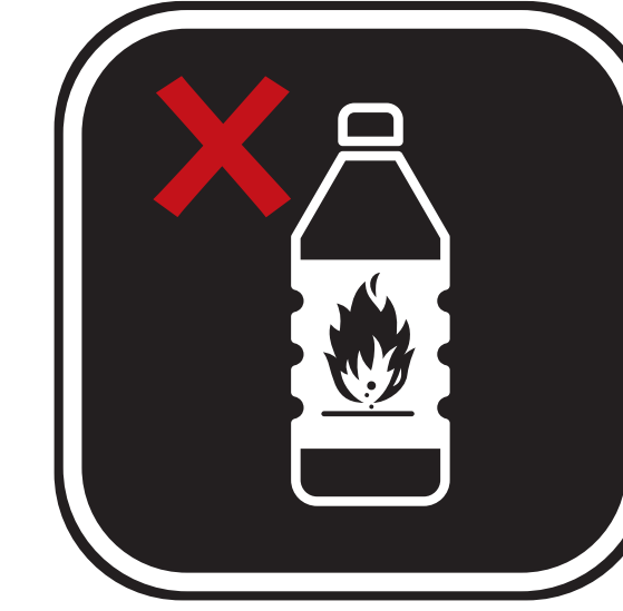
EXPLOSIFS, PRODUITS CHIMIQUES OU ENGINCS INCENDIAIRES EXPLOSIVES, CHEMICALS OR INCENDIARY DEVICES