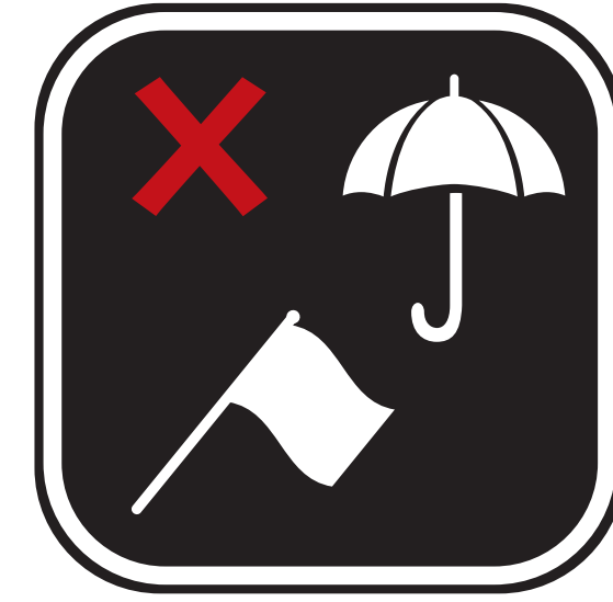
GRANDS DRAPEAUX/BANNIÈRES AUTRE DÉPASSANT PAS 60 CM X 60 CM); LARGE FLAGS/ BANNERS (NO LARGER THAN 60CM X 60CM);