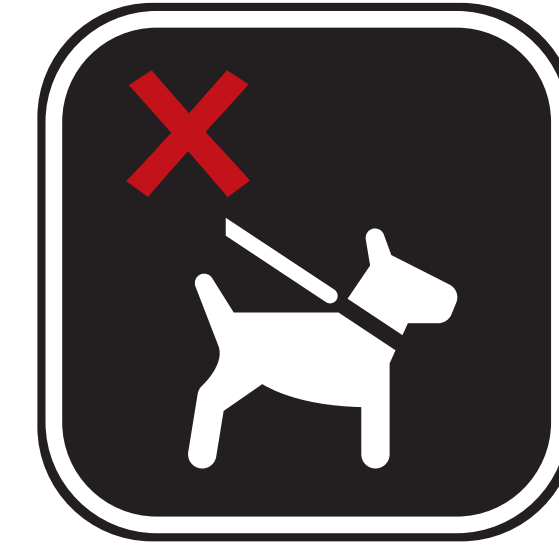
ANIMAUX, À L'EXCEPTION DE CEUX DRESSÉS POUR FOURNIR UNE ASSISTANCE OU DES FONCTIONS DE GUIDE ANIMALS, WITH THE EXCEPTION OF THOSE TRAINED ASSISTANCE OR GUIDE DUTIES