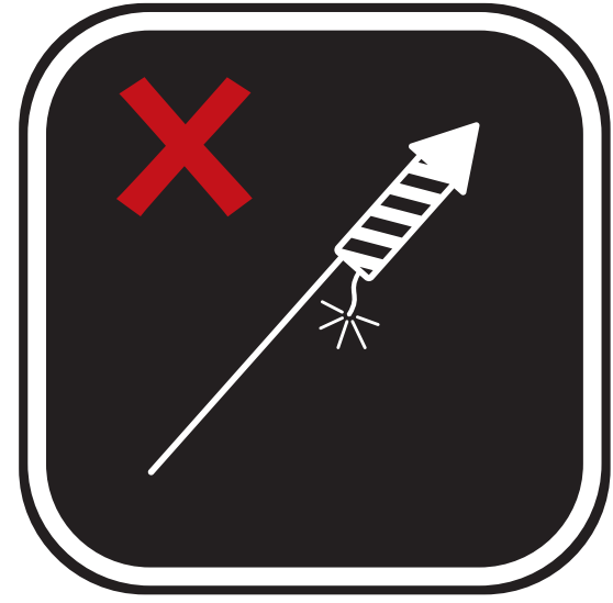
FEUX D'ARTIFICE, FUSÉES ÉCLAIRANTES ET PÉTARDS FIREWORKS, FLARES, AND FIRECRACKERS