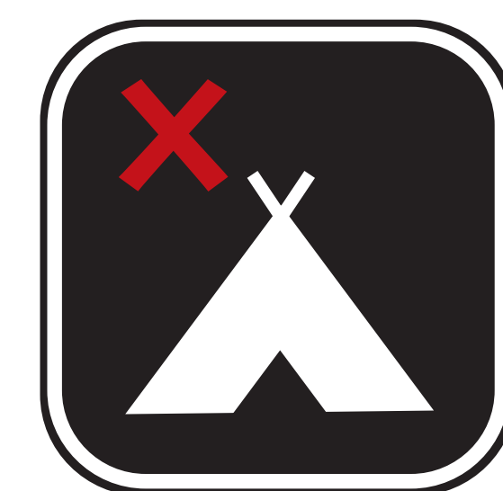
ÉQUIPEMENT DE CAMPING CAMPING EQUIPMENT