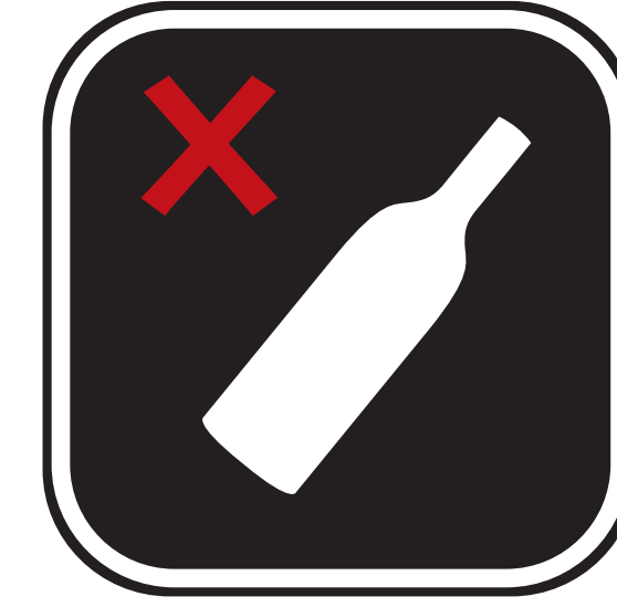
BOUTEILLES EN VERRE, CANETTES OU AUTRES OBJETS CONTONDANTS GLASS BOTTLES, CANS OR OTHER BLUNT INSTRUMENTS