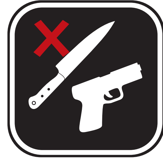
ARMES, RÉPLIQUES D'ARMES OU OBJETS RESSEMBLANT À DES ARMES WEAPONS, REPLICA WEAPONS OR ITEMS RESEMBLING WEAPONS