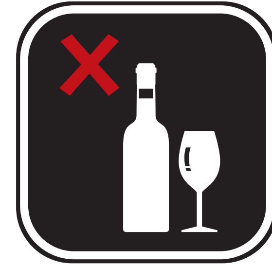
BOISSONS ALCOOLISÉES ACHETÉES EN DEHORS DU SITE ALCOHOLIC BEVERAGES PURCHASED OUTSIDE THE VENUE