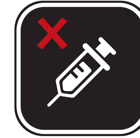
SUBSTANCES ILLICITES, Y COMPRIS LES DROGUES ET LES AIGUILLES ILLEGAL SUBSTANCES INCLUDING DRUGS AND NEEDLES