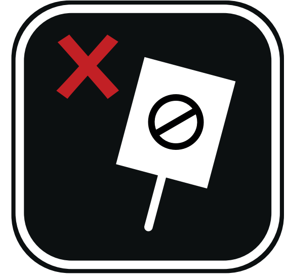
ARTICLES DE PROTESTATION PROTEST ITEMS